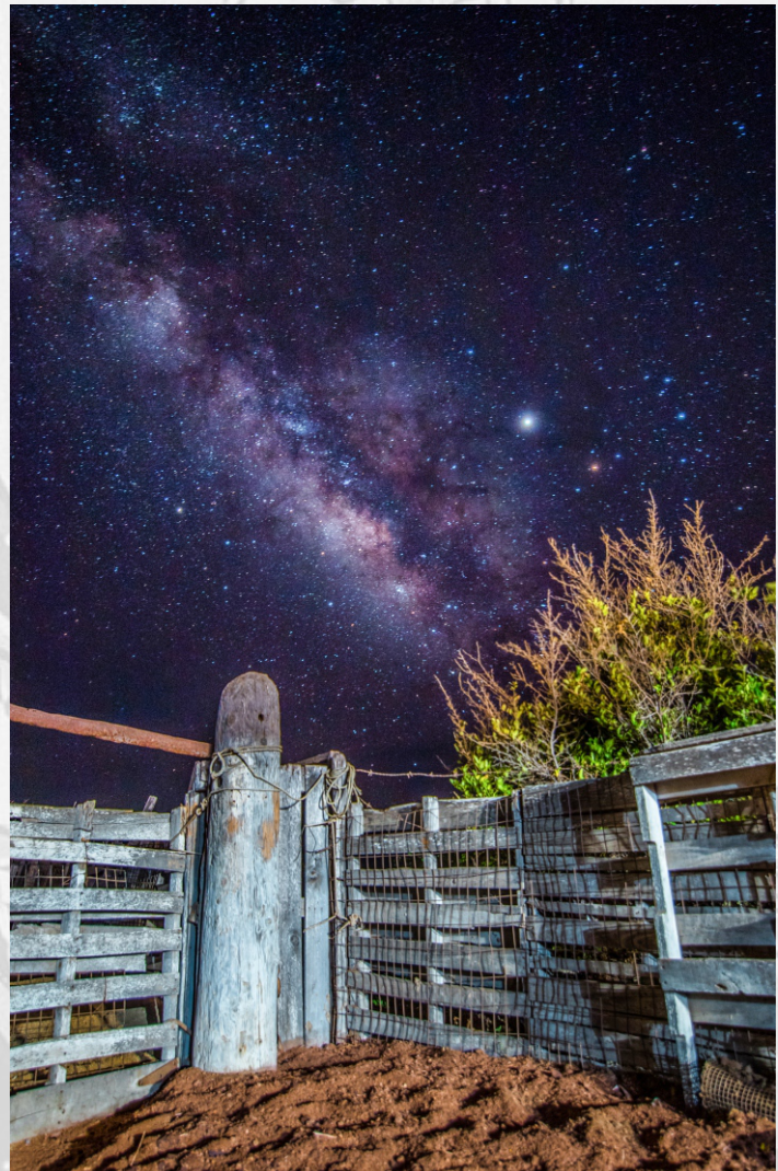
“Las luces de mi tierra”

“La fotografía para mí no solo se trata de capturar si no de interpretar, plasmar en una imagen el sentimiento de aquel momento”